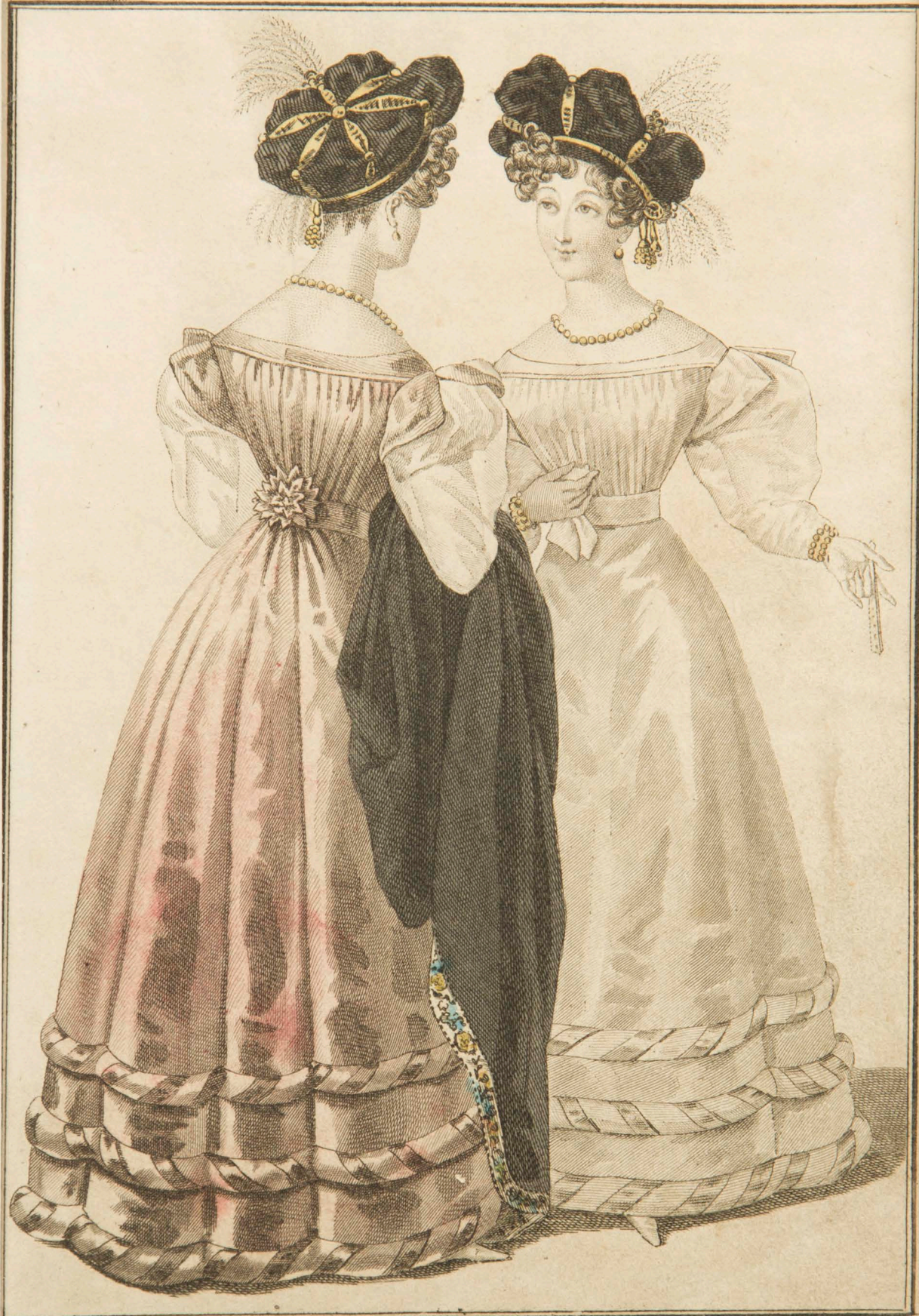
Coque de velours plain ornée de gances et deux aigrettes. Robe de velours garnie de rouleaux de velours entourés de rubans de satin.