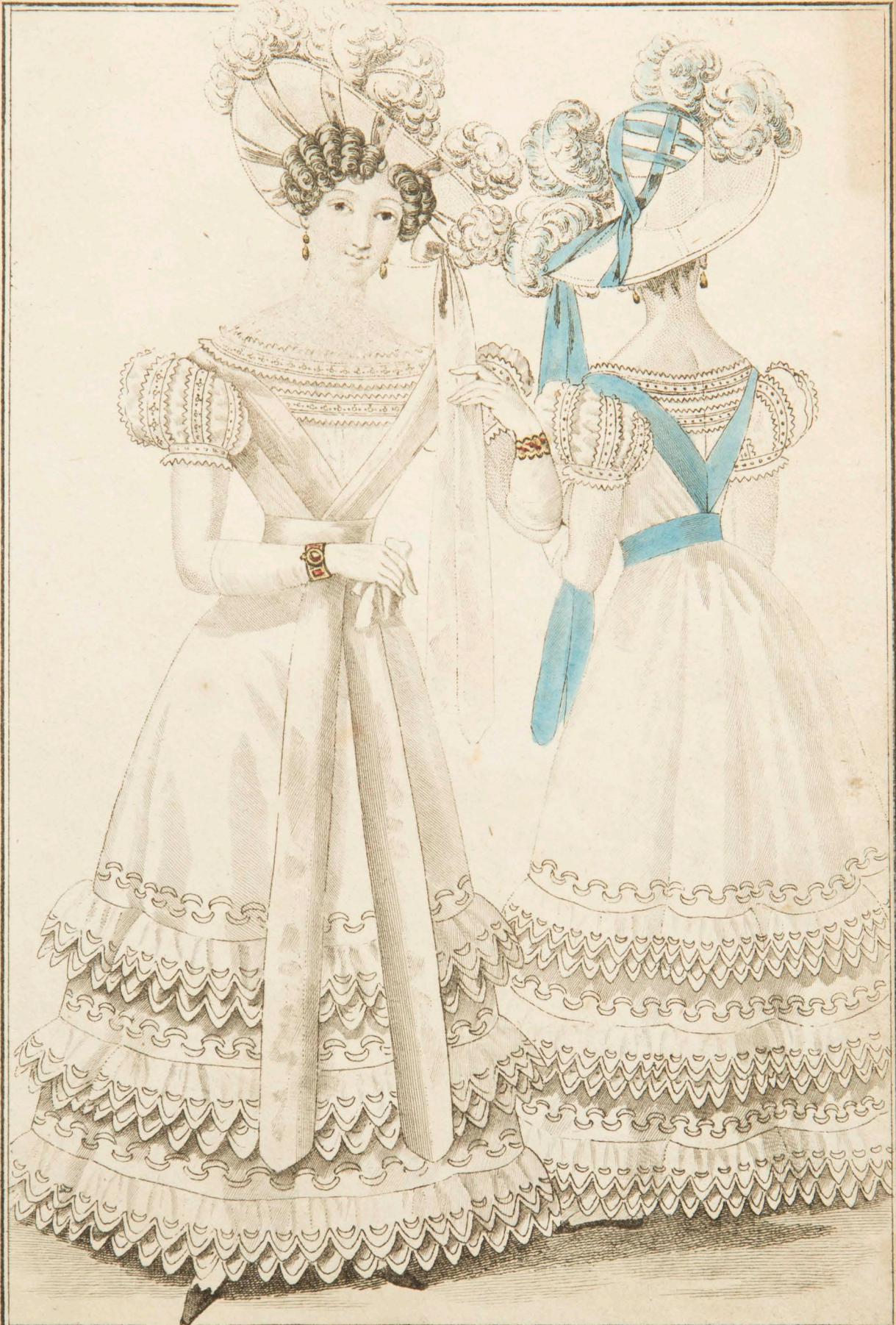
Chapeaux de paille de riz ornés de plumes frisées et de rubans de satin. Robes de mousseline brodées en coton et ornées de petits poignets bordés de tulle.