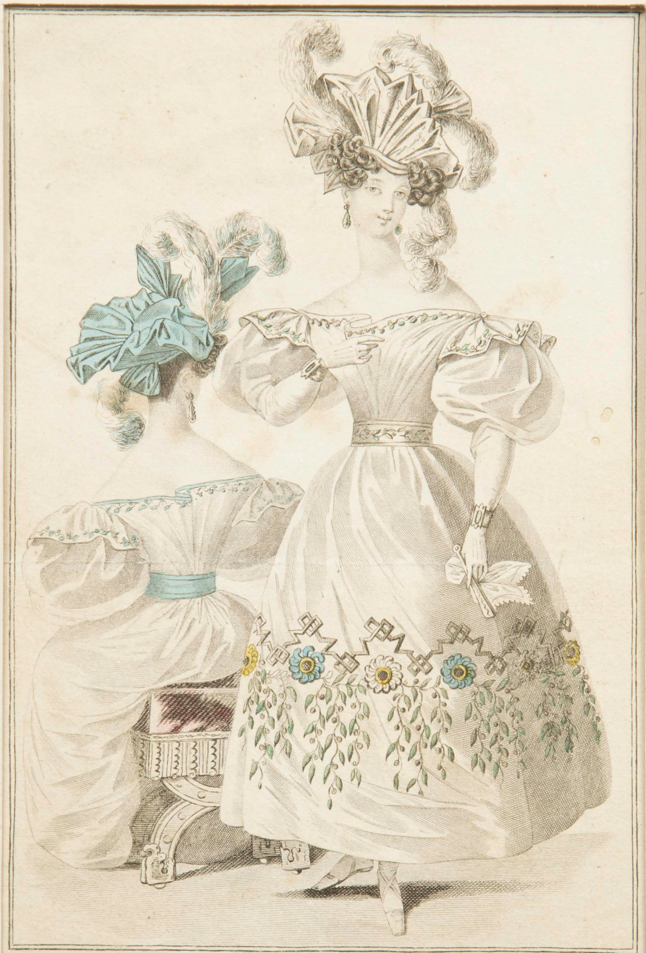
Petit Courrier des Dames. Boulevard des Italiens N o . 2. près le passage de l'Opéra Coiffure des M o is de M me Rousselot Vaublout, rue de Richelieu N o . 87