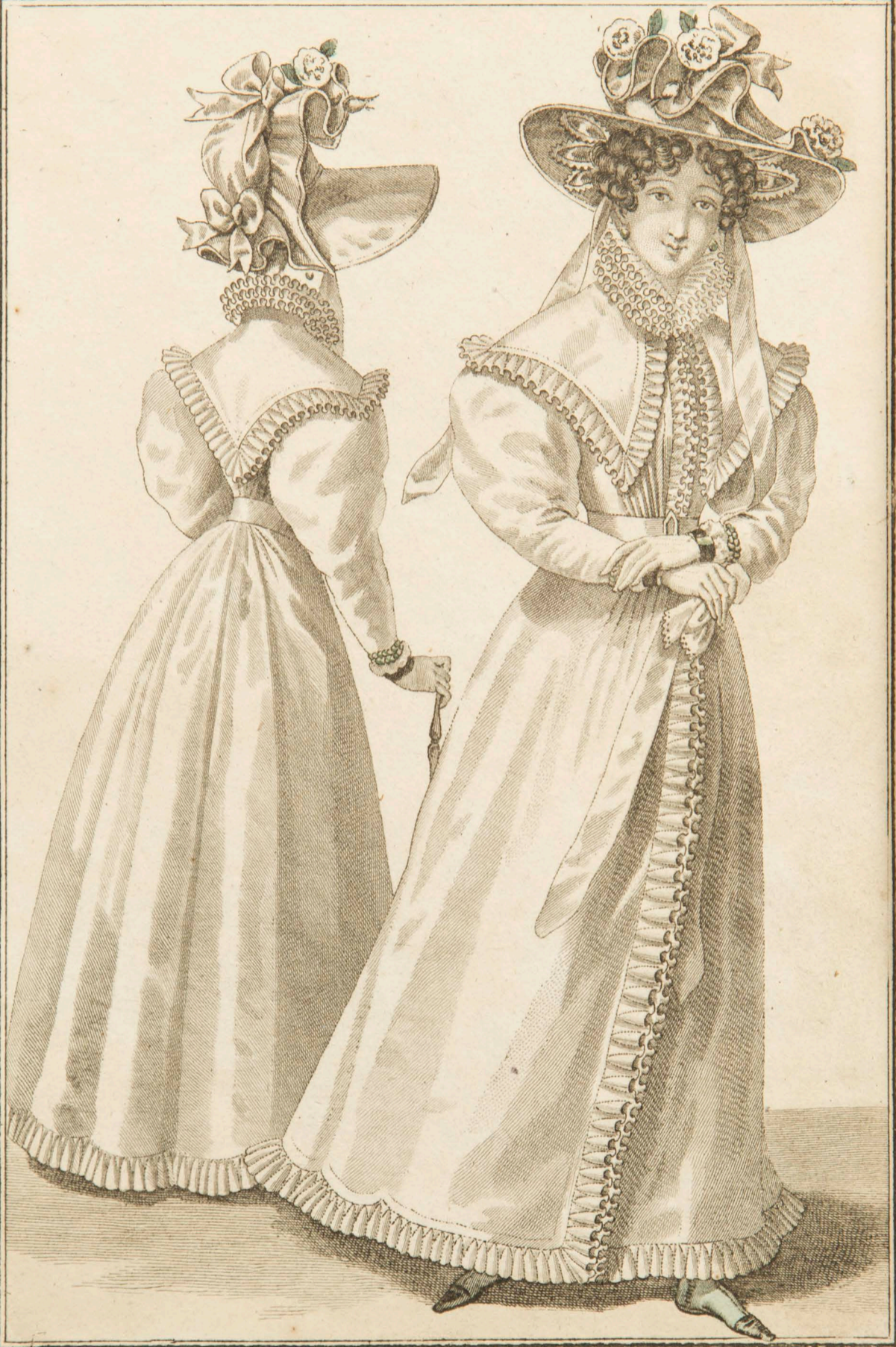
Capotes de gros de Naples. Redingotes de jaconnat à pèlerine en fichu garnies de volans de mousseline. Guêtres de prunelle.