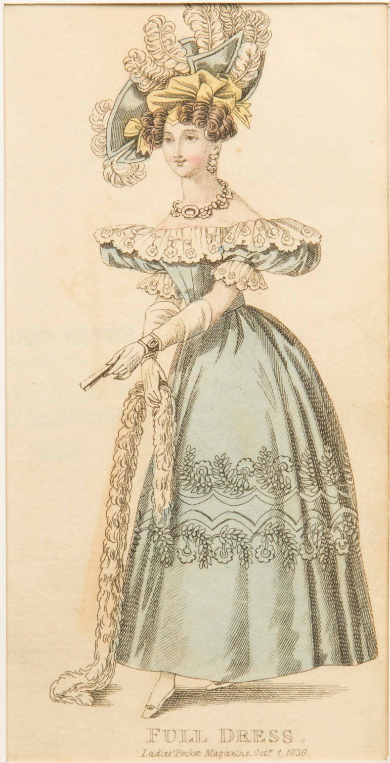
FULL DRESS. Ladies' Pocket Magazine, Oct 1, 1830.